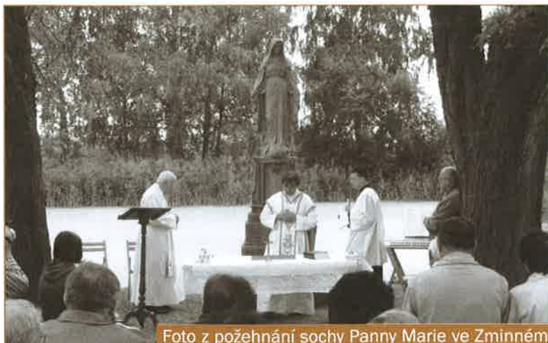
Foto z požehnání sochy Panny Marie ve Zmínném

Když se s námi pak loučil i náš pan farář, bylo z jeho slov patrné, o co by nám lidem mělo především jít. O umění naslouchat druhému, o tole-