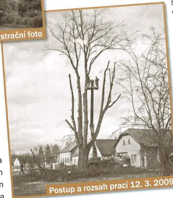
Postup a rozsah prací 12. 3. 2009

Dašické obecní vzrostlé stromy jsou desítky let odborně neošetřované. Část z nich je nevhodně rostlá, nemají jeden nosný kmen, ale jsou do „V“ a hrozí rozlomením, měly by být svázané stromovými pásy. V úžlabí „dvojáků“ se snadno uchytávají stromové nákazy. Stromy v našem parku jsou zbytečně nahusto. Vadí si vzájemně v růstu, táhnou se hodně nahoru. Mají vysoko těžiště a objemná hmota koruny může hůře odolávat větr-