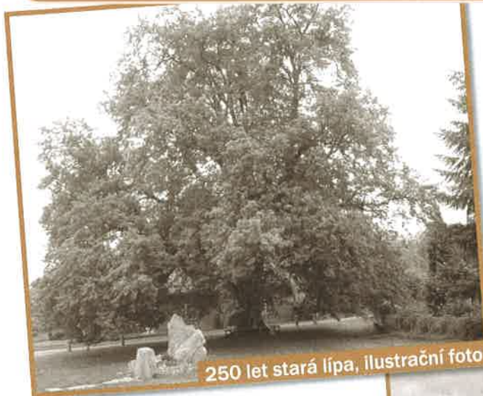
250 let stará lípa, ilustrační foto

Takhle vypadá lípa v malé obci, kde se o svou zeleň s láskou a odborně starají. Kolem lípy je posezení, lípa má citlivě prořezané větve a získala statut chráněného stromu. Tento „památný strom“ je asi 250 let starý.