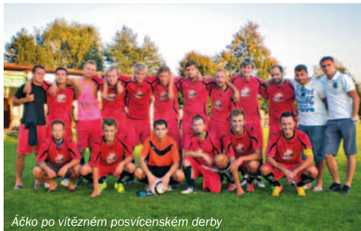
Áčko po vítězném posvícenském derby