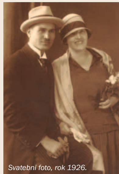
Svatební foto, rok 1926.