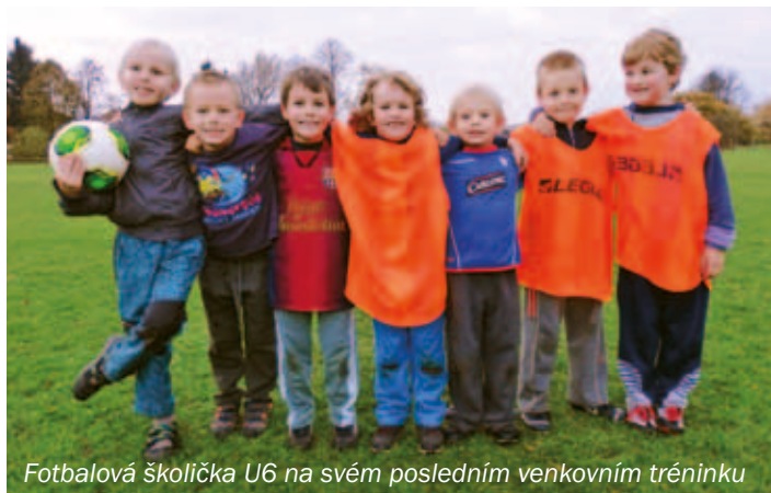
Fotbalová školička U6 na svém posledním venkovním tréninku