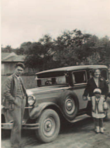
S dcerou, rok 1931.